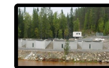
Gruv &amp; Miljöforskning