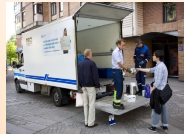
Miljöstation, Samlaren och Farligt Avfall-bil