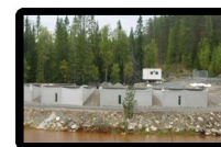
Gruv &amp; Miljöforskning