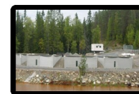
Gruv &amp; Miljöforskning