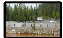
Gruv &amp; Miljöforskning